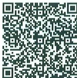
微信群 2-线下参会代表群