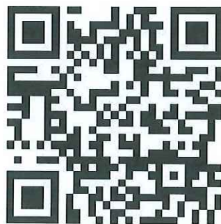
各会员单位相关材料提交二维码

4、各会员单位相关材料（典型经验、工作建议、嘉宾推荐等）提交请扫描 二维码或通过官网（ www.ieecweb.com ）进入：